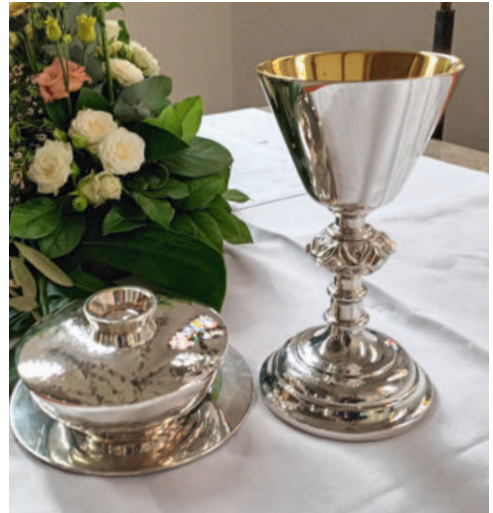
Bild: Abendmahlkelche

Durch Corona hat sich in unserer Gemeinde die Abendmahlpraxis verändert und aus hygienischen Gründen erfolgte der Umstieg auf Einzelkelche. Vor einiger Zeit gab es dann die Umstellung auf den normalen Kelch und die Austeilung in Form der Intinktion, sprich dem Eintauchen der Hostie in Wein oder Saft. Nachdem sich der KV aber nicht sicher war, ob das auch die von der Gemeinde gewünschte Form der Austeilung ist, gab es in den letzten Monaten eine Umfrage zum Thema Abendmahl. Dabei kam heraus, dass eine deutliche Mehrheit die Form mit Kelch und Intinktion bevorzugt, so dass wir das Abendmahl weiterhin in dieser Form austeilen. Für die Austeilung noch eine Bitte des KV: Diese erfolgt in so vielen Kreisen, bis alle am Abendmahl teilgenommen haben. Sprich, die Kreise im Altarraum müssen nicht so eng sein. Und seien Sie sicher: An niemandem wird der Kelch vorübergehen.