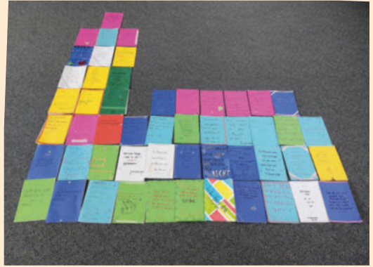
Eine Kirche aus den Konfisprüchen unserer Konfirmandinnen und Konfirmanden