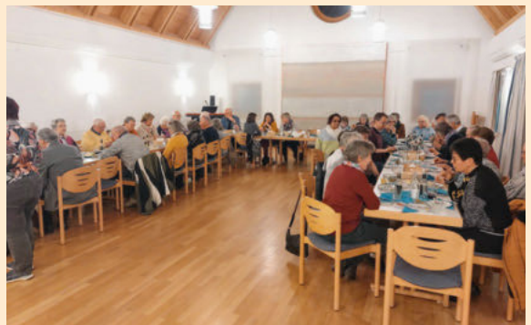
Intensive Gespräche beim diesjährigen Tischabendmahl am Gründonnerstag