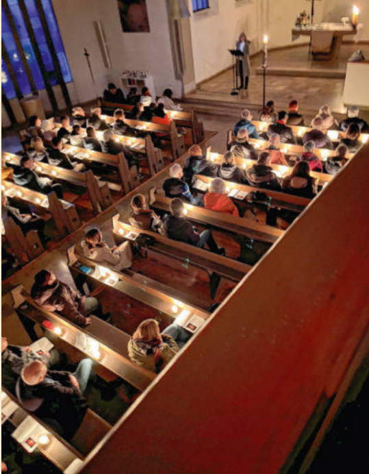
Feier der Osternacht 2024